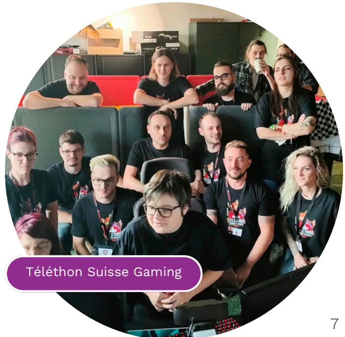
Téléthon Suisse Gaming