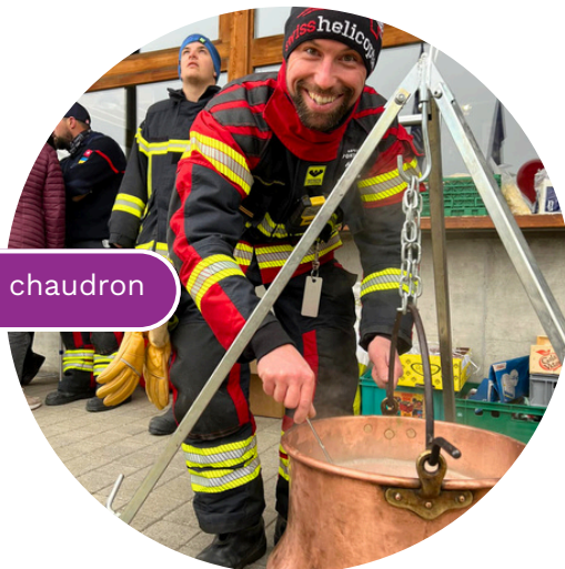
Soupe au chaudron

En principe, les communes mettent gratuitement à disposition leurs salles, mais il faut s'y prendre à l'avance car la période de décembre est souvent très chargée.