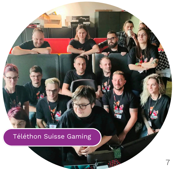
Téléthon Suisse Gaming