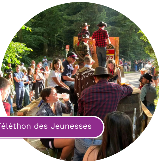
Téléthon des Jeunesses

Gamers à vos manettes ! Depuis 2020 des streamers francophones se réunissent pendant une semaine et récoltent des fonds en jouant et en animant la chaîne Twitch du TSG. Participez comme spectateur et donateur ou streamez votre contenu préféré en ajoutant à votre chaîne la cagnotte en ligne du Téléthon Suisse Gaming. Le Téléthon Suisse Gaming aura désormais lieu en LAN tous les deux ans, retour de la manifestation en décembre 2025.