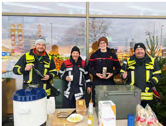
Die Feuerwehr von Naters sammelte Geld.

Während des Wochenendes herrschte in der Schweiz besonders grausiges Wetter, was zahlreiche Besucher von einem Besuch der Veranstaltungen abhielt.