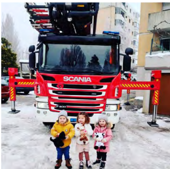
Les pompiers de Sion ont livré des peluches avec leur grande échelle !