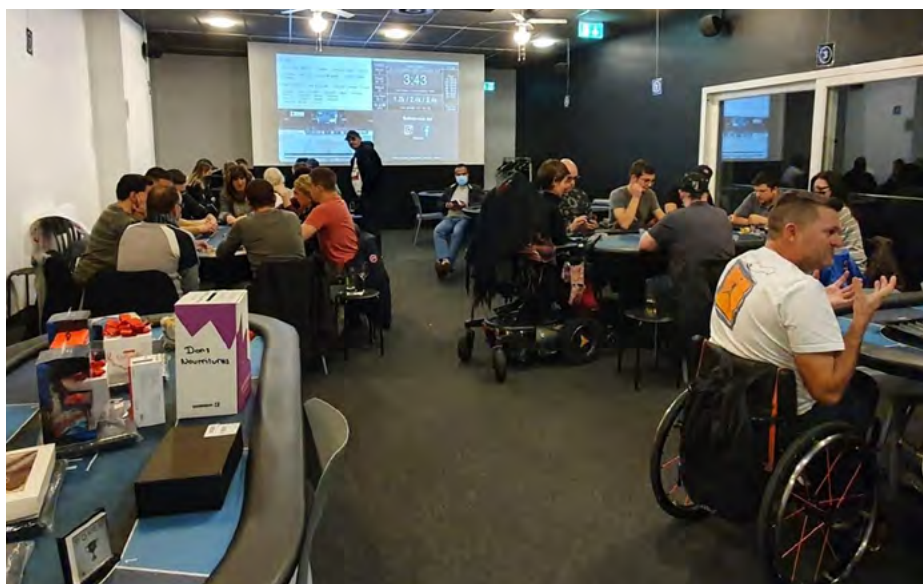
Le traditionnel tournoi de poker du Téléthon Fribourg a réuni les passionnés et amateurs, et grâce à cette belle organisation a récolté Fr. 2360.- de dons.