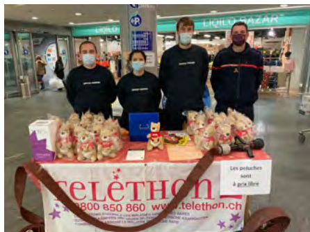
Le Téléthon Genève – Les sapeur-pompier de Vernier au centre commercial de Blandonnet