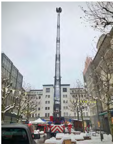
Bei der Feuerwehr von Siders konnte man die 42 m-Leiter ausprobieren.

Ein riesiges Dankeschön an alle Freiwilligen!